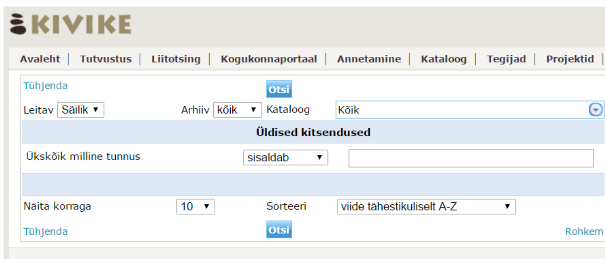
Joonis 2. Liitotsing