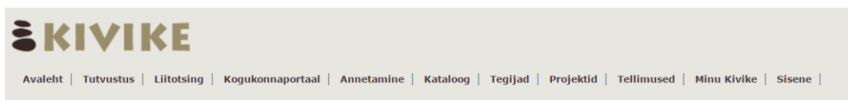
Joonis 1. KIVIKEse avalehe menüü

KIVIKEse avaleht sisaldab palju erinevat informatsiooni. Navigeerimiseks on ühetasemeline horisontaalmenüü 11 komponendiga (vt Joonis 1). Rubriik „Tutvustus“ loob vertikaalse ühetasemelise menüü 11 komponendiga, mille sisu ilmub valimisel vabale alale menüüst paremal. Liitotsingu (vt Joonis 2) väljade arv täieneb vastavalt olemasolevate täitmisele. Väljade sisu puhul on kasutatud lühendeid (näiteks „Arhiiv“ välja valikutes), mille tähendused asuvad „Tutvustuse“ menüüvaliku „Arhiivide tutvustus“ lehel.